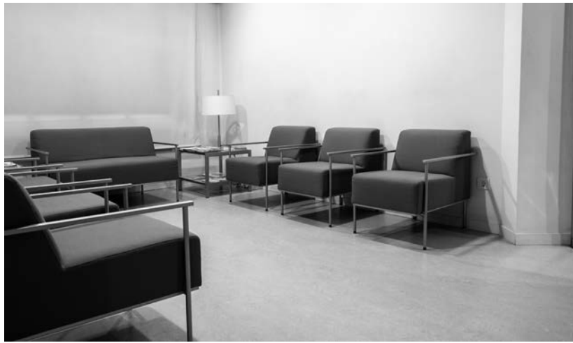
Sala de espera